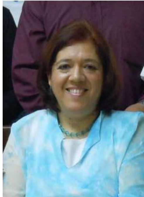
PRESIDENTA DE UNIDAD MEXICO