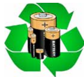
No tires pilas usadas