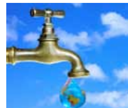
Cuida el agua