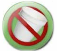
No utilices desechables de unicel