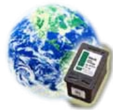
Recicla cartuchos de impresora