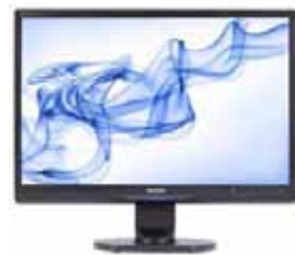
Reduce el brillo del monitor