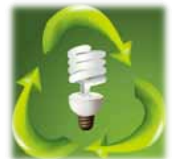
Cambia tus focos por focos ahorradores