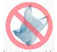
Evita la contaminación con bolsas de plástico.