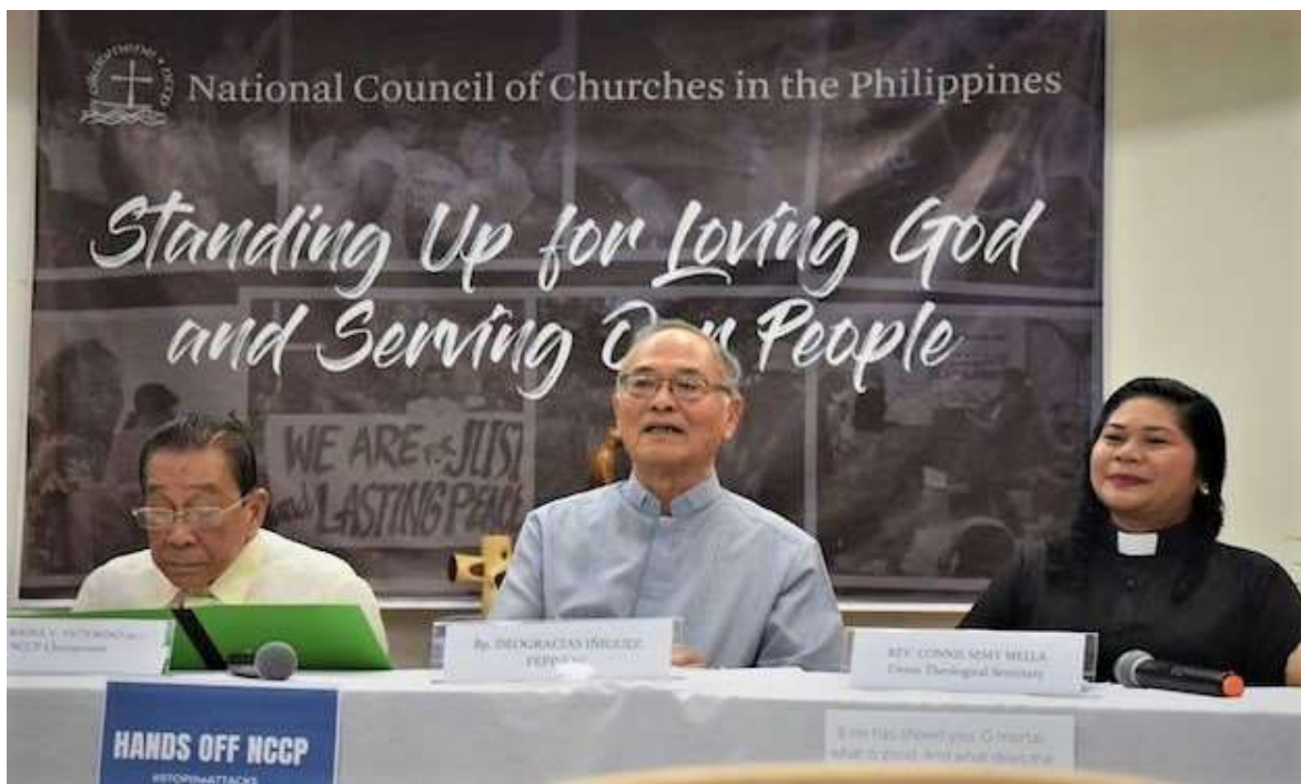
Imagen de la rueda de prensa que ofreció el Consejo Nacional de Iglesias junto con otras entidades para denunciar la decisión del gobierno.

FUENTE: Protestante Digital. Manila, Filipinas. Noviembre 26, 2019. El Departamento de Defensa Nacional de Filipinas ha incluido al Consejo Nacional de Iglesias del país (NCCP, por sus siglas en inglés) en la lista de “organizaciones de grupos comunistas terroristas locales”. Además, otras entidades dedicadas al servicios y organizaciones humanitarias también han sido añadidas al documento que presentó el pasado 5 de noviembre el general y subjefe de personal de inteligencia de las Fuerzas Armadas Filipinas, Reuben Basiao.