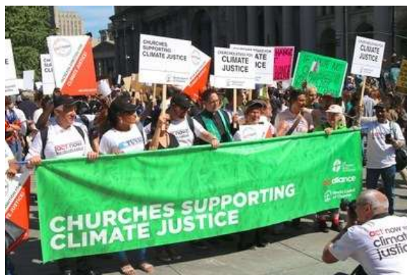
Las iglesias defienden la justicia climática en Nueva York, septiembre de 2019.