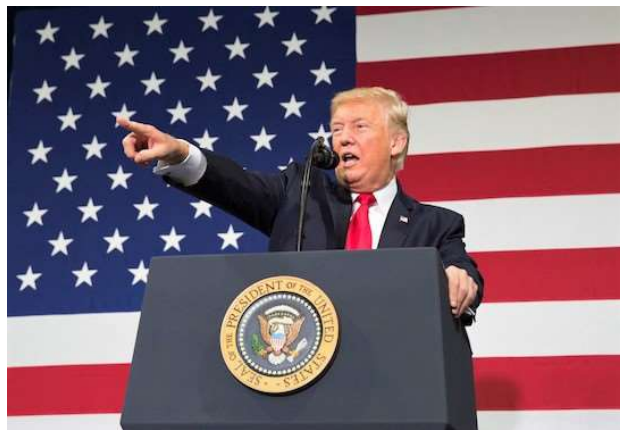
Donald Trup durante un mitin.

Un editorial de Christianity Today cuestionando la continuidad del presidente abre un intenso debate que ha tenido un amplio eco en los medios.