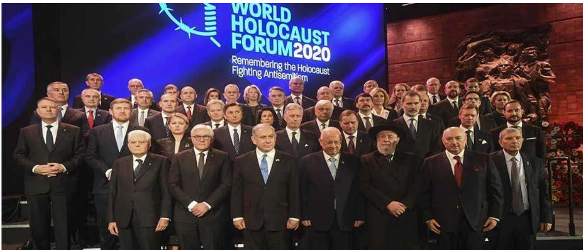
Foto de familia del grupo de líderes que se han reunido en el Foro Mundial sobre el Holocausto.

Más de 45 líderes y representantes de diferentes países se han reunido en la cumbre, celebrada en Jerusalén.