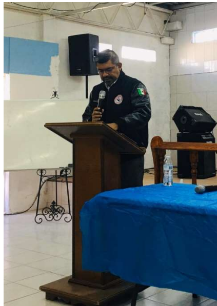
Obispo Rodolfo Rivera compartiendo el mensaje de apertura.

La reflexión episcopal se centró en los planes 2020, de los cuales, básicamente hizo referencia a su preocupación por las familias pastorales y su interés por poder visitar y atender cada familia pastoral de la Conferencia; el poder aplicar la justicia, así como el poder vivir en una comunidad de fe donde todos podamos regirnos de acuerdo a lo que establece nuestra disciplina y la Escritura; y el que como Conferencia podamos tener todas nuestras propiedades legalizadas lo más pronto que sea posible. Al finalizar su meditación, invitó a los pastores del Distrito Jabes a pasar al frente y pedir a los miembros de la Asamblea que estuvieran orando por sus pastores en tanto que él dirigía una plegaria en voz alta.