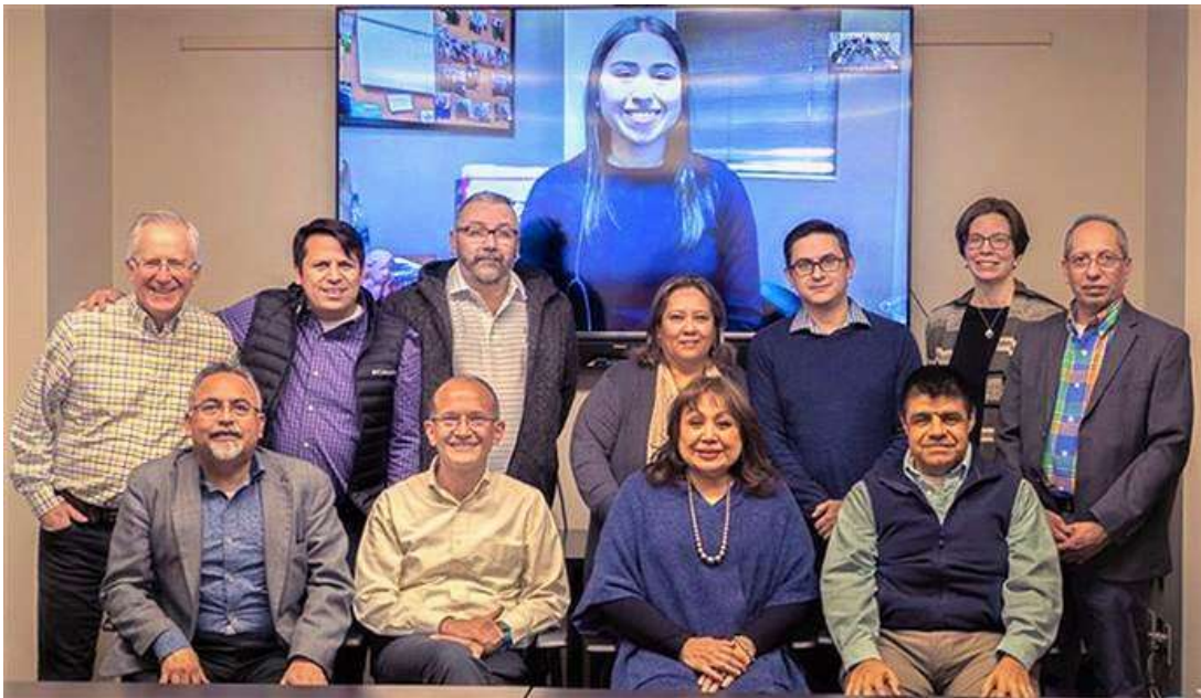
La Obispa Minerva Carcaño (centro), reunida con líderes de la Conferencia Anual California-Pacífico y del Consejo de Ministerios Hispano-Latinos de la Jurisdicción Oeste.