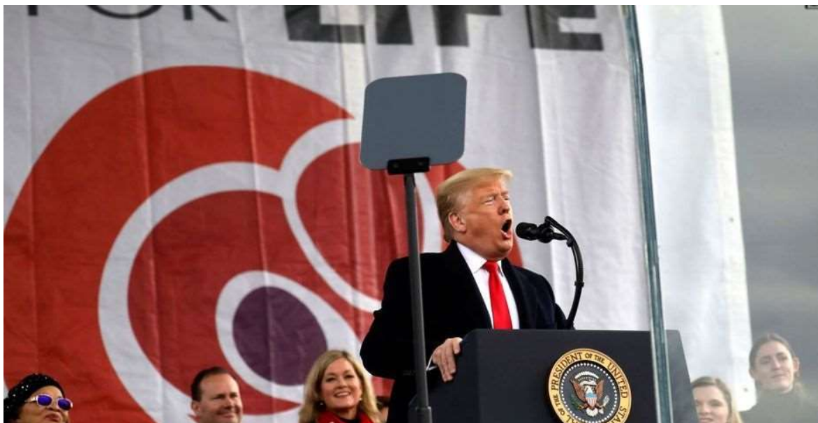
Donald Trump, durante su discurso en la Marcha por la Vida.

FUENTE: Protestante Digital. Washington, D.C., EUA. Enero 27, 2020. Miles de personas se reunieron en Washington el viernes para la 47ª Marcha por la Vida, un encuentro anual que conmemora la sentencia Roe v. Wade de la Corte Suprema.