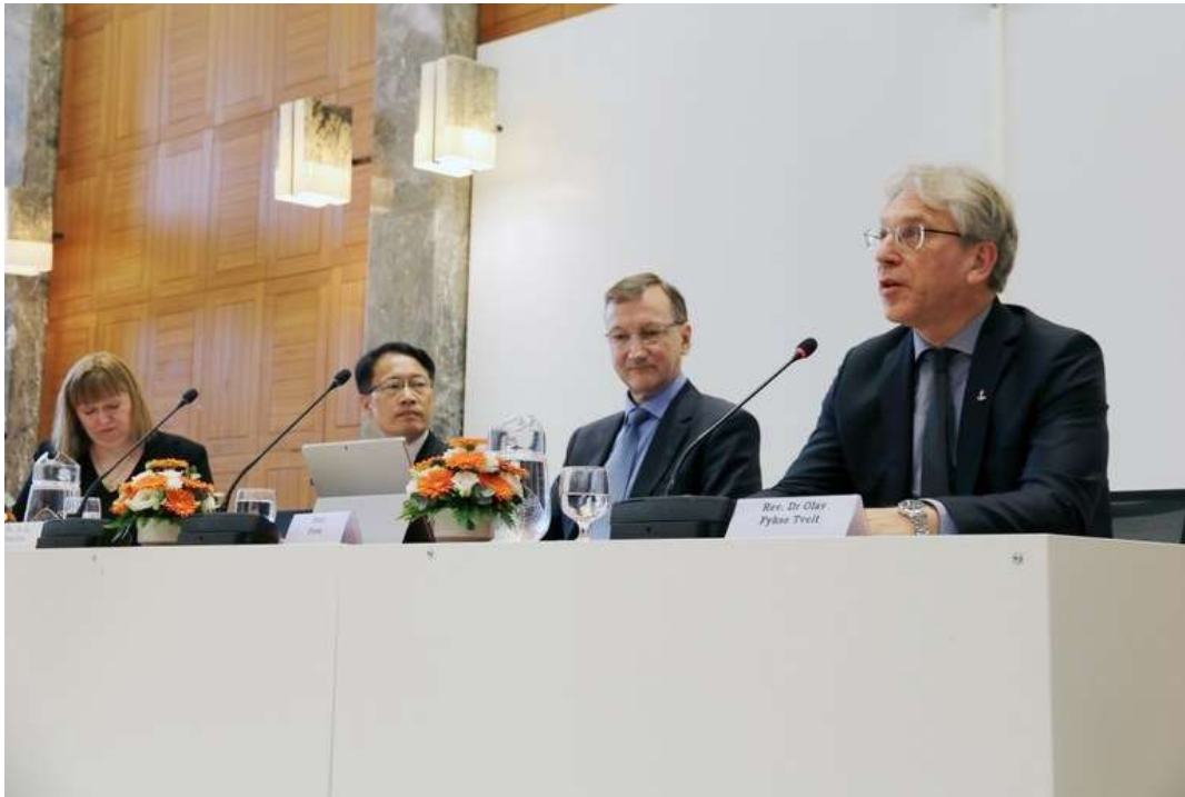
El secretario general del CMI, Rev. Dr. Olav Fykse Tveit, invita a las iglesias de todo el mundo a sumarse a las oraciones por la paz en la península de Corea.

“Aspiramos sinceramente a poner fin a la guerra de Corea, declarando el reemplazo del Acuerdo de Armisticio por un tratado de paz”, dijo Tveit.