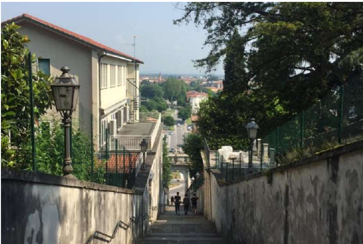
Un barrio de Vicenza, en el norte de Italia.

Giacomo Ciccone. En el resto del país, se estima que casi la mitad de iglesias decidieron no reunirse, optando en muchos casos por “retransmitir por internet o compartir grabaciones de predicaciones”.