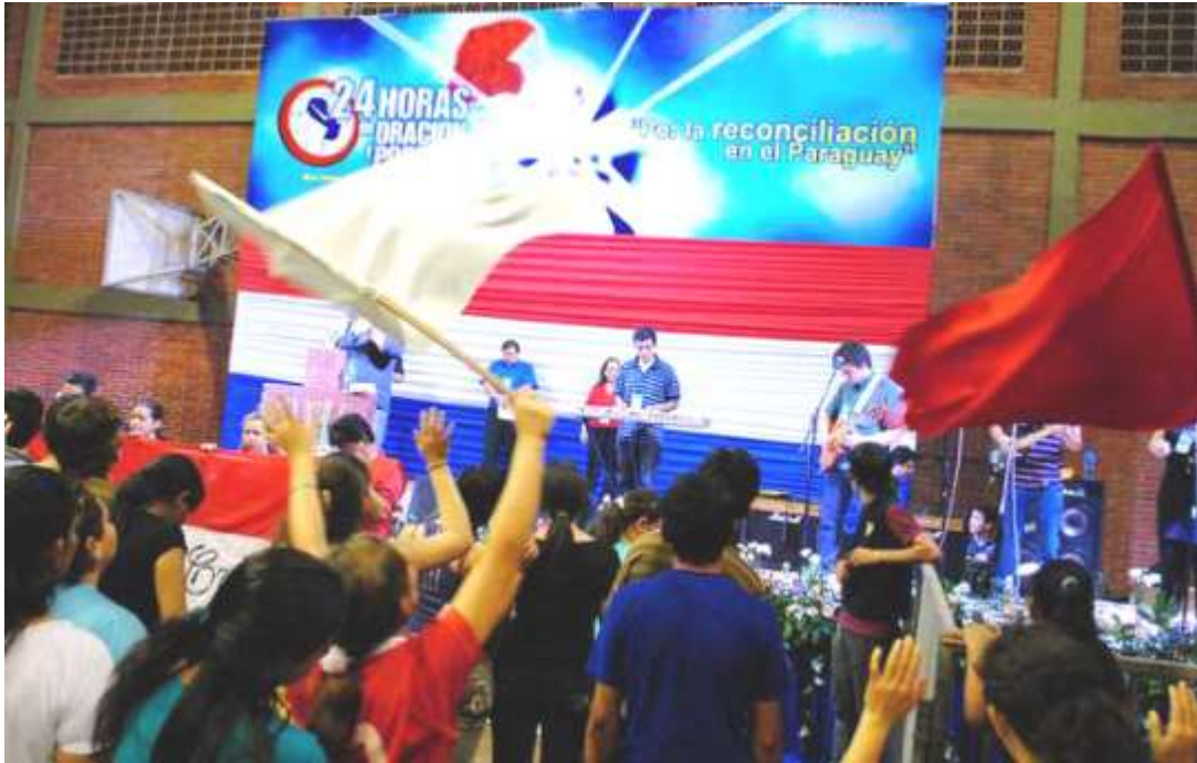
Nacional de Oración de Paraguay en 2014

FUENTES Agencias ASUNCIÓN 13 DE AGOSTO DE 2015 15:00 h