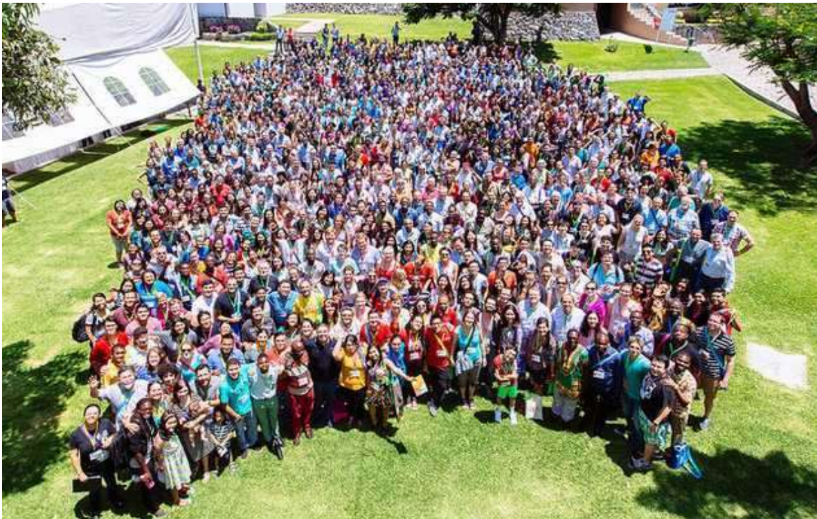
Foto de grupo de los asistentes a la Asamblea Mundial Internacional de Estudiantes Evangélicos (CIEE-IFES) en México (2015)