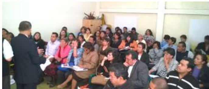
Grupo de trabajo 1