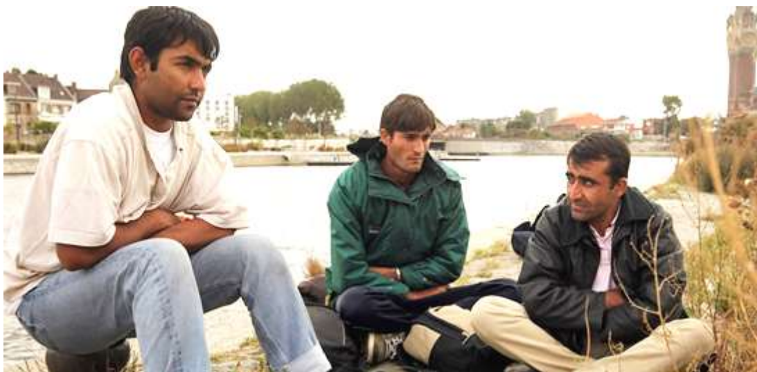
Inmigrantes en Calais.

Bautistas, anglicanos, reformados y metodistas, al gobierno británico: "Las Escrituras muestran la importancia del amor y compasión por todos los desamparados, incluidas personas que vienen a vivir a nuestras comunidades".