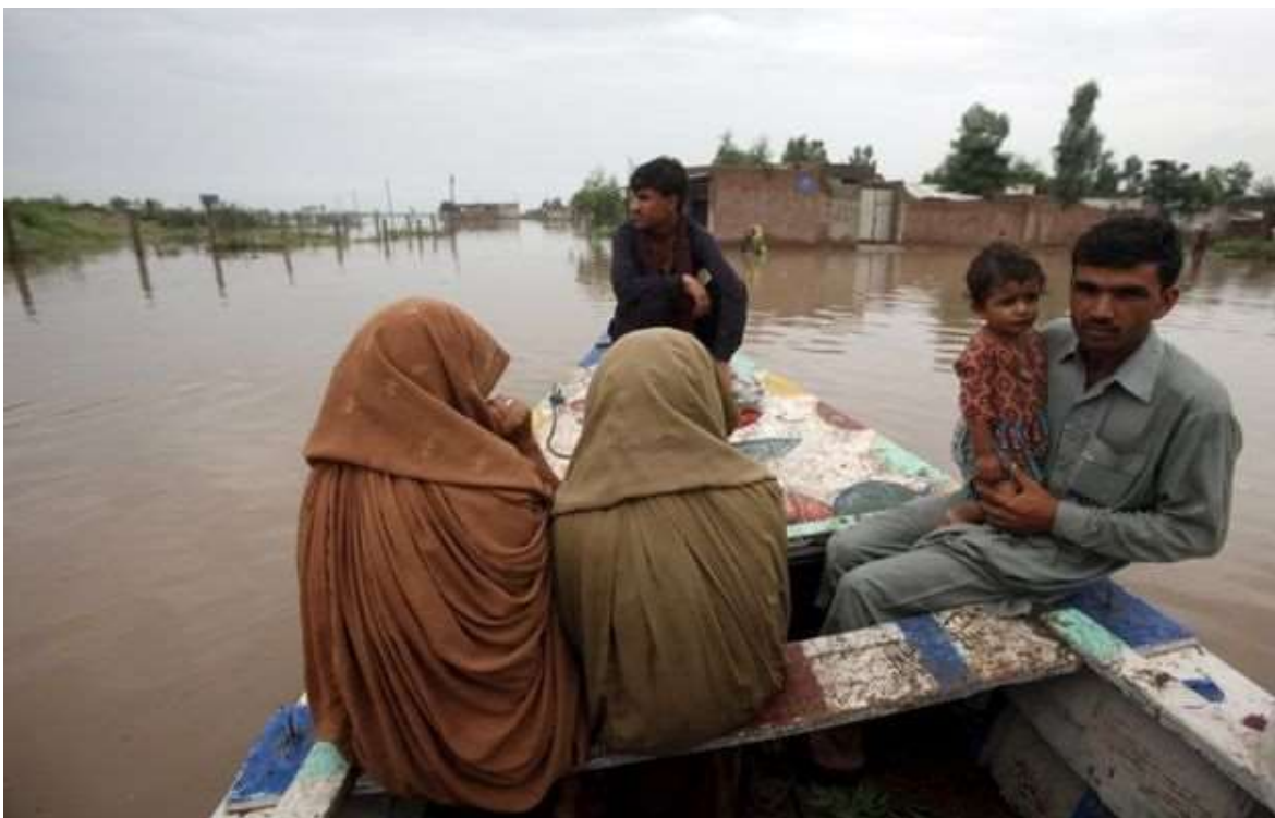
PAQUISTÁN 29 DE AGOSTO DE 2015 15:30 h Una familia es rescatada tras las inundaciones provcadas por monzones torrenciales