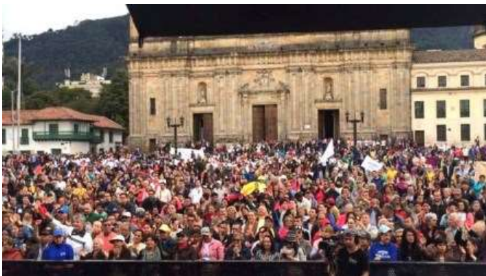
Orando en la Plaza Bolívar

Los representantes de la comunidad evangélica reunidos en la capital del país dejaron claro que además de orar “creen y construyen paz”.