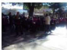
IMM SIMULACRO A NIVEL NACIONAL

Te presentamos un vistazo de las noticias mas relevantes del Instituto Mexicano Madero; solo haz clic en la imagen para navegar en el sitio web del IMM.