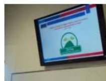
IMM ¿SABES QUÉ ES SSYMA?