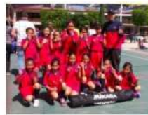
PRIMARIA OLIMPIADAS DEPORTIVAS