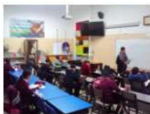
PRIMARIA HÁBITOS DE ESTUDIO