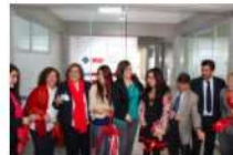
UMAD NUEVAS ÁREAS Y MÁS INFRAESTRUCTURA