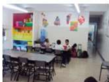
PRIMARIA TALLER DE NIVELACIÓN