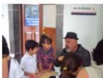
PRIMARIA CUENTA CUENTOS