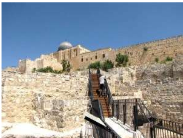
Today was inaugurated the First Temple Period Ophel City Walls Site in the Walls Around Jerusalem. June 21 2011.

Asa, Rey de Judá”, que corresponde al monarca que gobernó sobre Judea en el siglo 8 A.C.