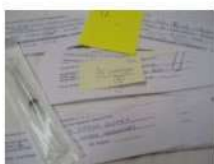
PRIMARIA CAMPAÑA DE VACUNACIÓN