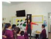
PRIMARIA TRABAJANDO LOS VALORES CON PAPÁS