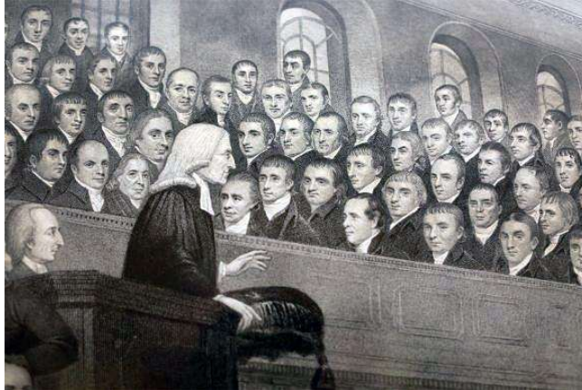
Un representación de Juan Wesley predicando en la Capilla de City Road en ciudad de Londres, cuela dentro de la Antigua Rectoraría en Epworth.