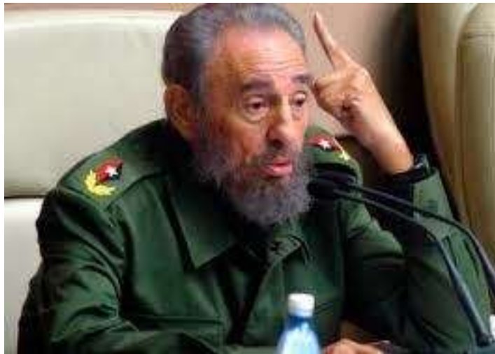
Fidel Castro, en La Habana en 1985

El teólogo evangélico Juan Stam relata un encuentro insólito que vivió en primera persona. Ocurrió en 2002, en La Habana, entre un grupo de pastores protestantes y Fidel Castro.