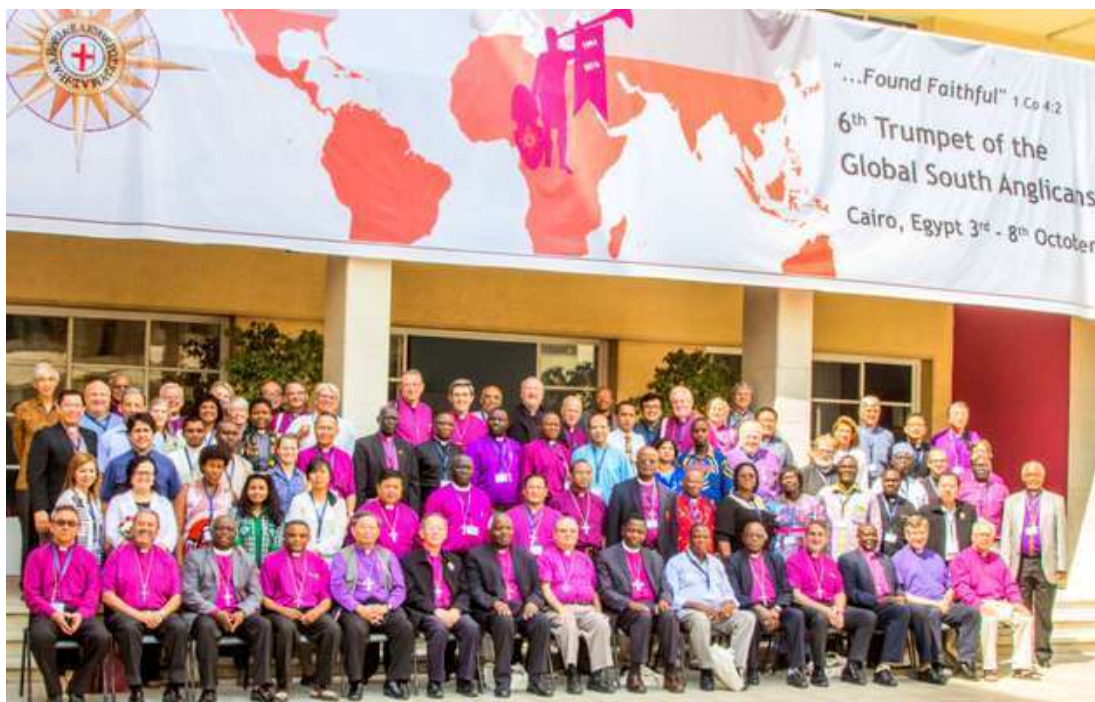
Foto de los participantes de GAFCON en el Global South Conference de El Cairo

Las Iglesias anglicanas del Cono Sur tras la “Global South Conference” manifiestan en un documento que las relaciones homosexuales “son contrarias al plan de Dios” sin minimizar otros pecados “contrarios al camino deseado por Dios para la humanidad”.