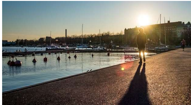
Caminando al atardecer en Helsinki, Finlandia.

El número de finlandeses que dicen creer en el Dios del cristianismo ha aumentado de un 27% a un 33% en 4 años. “La gente está pensando sobre su relación con la Iglesia”, dice el investigador Kimmo Ketola.