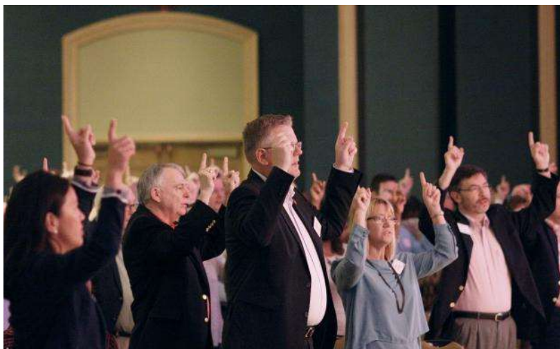
Líderes de la iglesia cantando durante el culto del Gabinete Extendido del Concilio de Obispos de La Iglesia Metodista Unida en Jacksonville, Florida. Más de 750 líderes se reunieron para discutir como centrarse en la misión y el desarrollo de congregaciones vitales.

“La Iglesia Metodista Unida, así como muchas denominaciones cristianas, experimenta un decrecimiento constante en los Estados Unidos, porque durante muchas generaciones la gente ha perdido interés por lo institucional. Esto no es necesariamente culpa nuestra. No hemos creado el entorno donde nos encontramos. Pero, ¿tenemos la capacidad de adaptarnos y cambiar?”, preguntó el Obispo Hagiya.