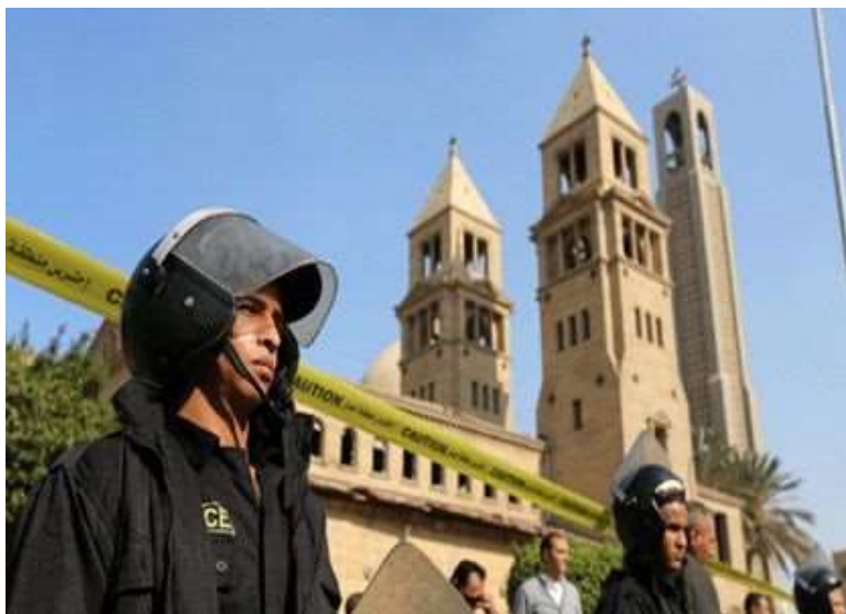
Cientos de cristianos coptos se manifestaron tras el atentado pidiendo al Gobierno que refuerce la seguridad.