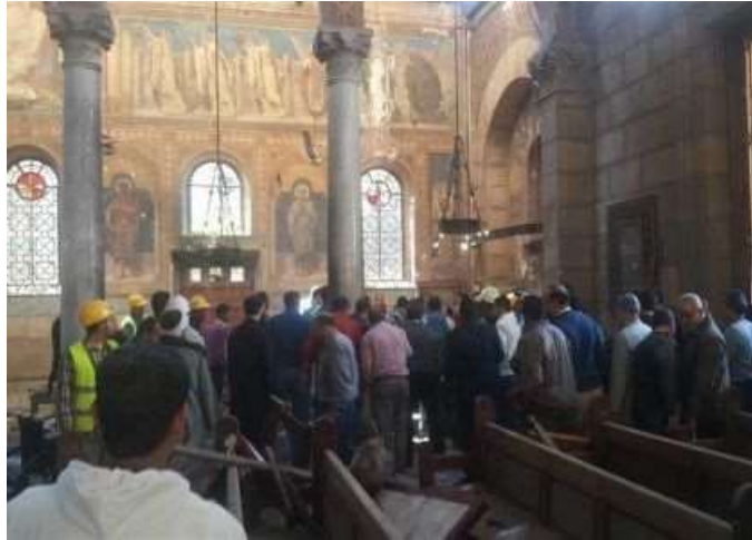
Interior de la Catedral, tras la explosión.

Sin embargo, en los últimos meses se han multiplicado los episodios de violencia hacia los cristianos en Egipto. El pasado mes de noviembre se provocaron incendios en casas y negocios de cristianos.