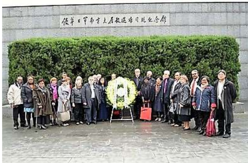
El Comité Ejecutivo del CMI.

01 de diciembre 2016. Versión en español publicada el: 08 de diciembre 2016. Del 17 al 23 de noviembre, el Comité Ejecutivo del Consejo Mundial de Iglesias (CMI) se reunió por primera vez en China. La visita fue organizada por el Consejo Cristiano de China y el Movimiento Patriótico de las Tres Autonomías. El Movimiento Patriótico de las Tres Autonomías es una iglesia protestante de la República Popular China, además de uno de los organismos protestantes más grandes del mundo.