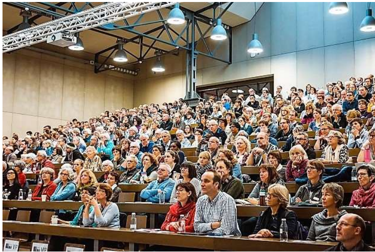
Más de 800 participantes en la conferencia de refugiados StopArmut 2016.

En la conferencia, organizada en Berna por evangélicos, participaron refugiados, políticos y miembros de iglesias y ministerios.