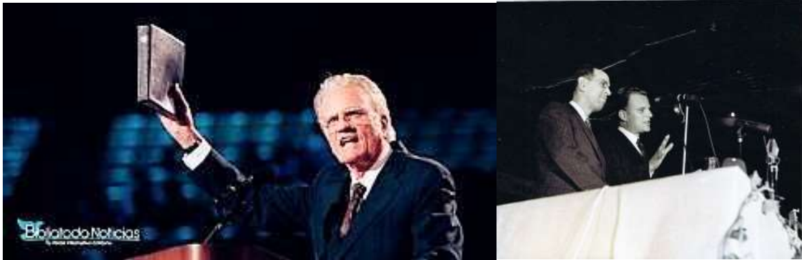
Foto izquierda, original de la nota. Foto derecha, Billy Graham en Campaña Evangelística en México en los años cincuenta.

Billy Graham respondió: “La mayoría de la gente probablemente diría que la Navidad, ya que ocupa más de su tiempo y atención. Pero en realidad ambas deben ser de gran importancia, porque ambas deben recordarnos la bondad de Dios hacia nosotros, primero proveyendo nuestras necesidades diarias y luego enviando a Su Hijo al mundo para nuestra salvación. La Biblia dice: “Dad gracias al Señor, porque él es bueno; Su amor perdura para siempre “(Salmo 106: 1)”.