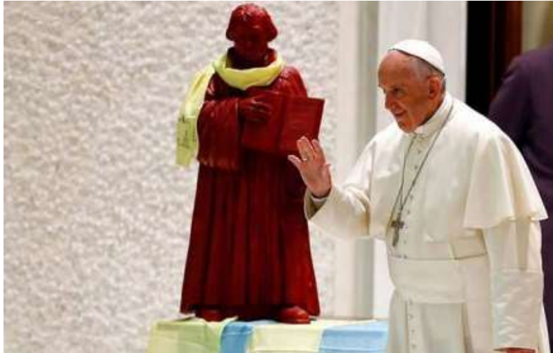
El Papa coloca una estatua de Lutero en el Vaticano

Iglesia católica y Consejo Mundial de Iglesias elaboran un texto consensuado para la Semana de Oración por la Unidad de los Cristianos que se celebra en enero.