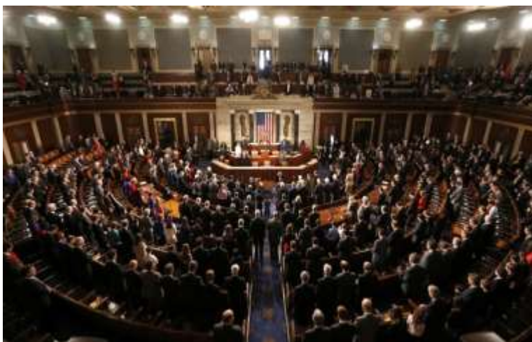
Imagen de archivo del Congreso de EE.UU.

en la Cámara. Esta lista no implica que sean practicantes o no, sino simplemente recoge cómo se define cada uno de los congresistas.