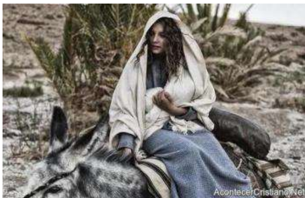
Imagen de María de la serie “La Biblia”.

“En este documento se solicita respetuosamente que Francisco reconozca y honre públicamente a María, la madre de Jesús, como “corredentora, así como Jesús el Redentor”, para la celebración del centenario de las apariciones de María en Fátima, Portugal”, dice el documento, según publica Church Militant News.