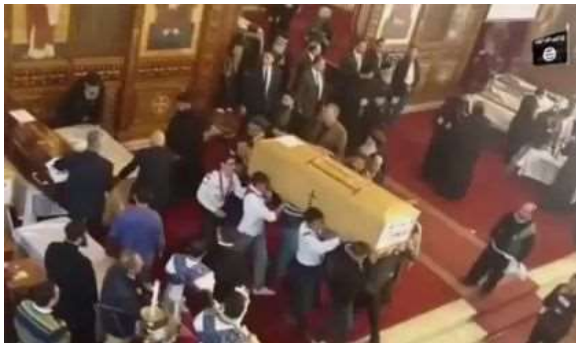
Imagen de los funerales por el atentado en la catedral copta de San Marcos, utilizados por Daesh en el último vídeo amenazando a los egipcios.

promete ver la liberación de islamistas encarcelados cuando el grupo tome el control de la capital. Al-Masri -que significa “el egipcio”- fue el nombre de guerra que Daesh dio al terrorista detrás del atentado suicida en la Catedral de San Marcos.