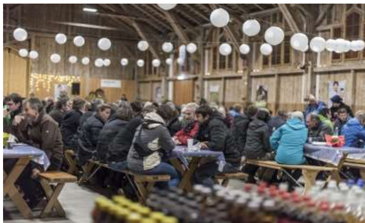
Comida en la Conferencia de Agricultores 2017. / Bauernkonferenz

Agricultores jóvenes y veteranos oraron unos por otros durante una de las veladas. El programa también incluyó una barbacoa y “Alpenmusik” en directo. El evento contó incluso con la participación de políticos y representantes de asociaciones agricultoras seculares. El próximo año, esta conferencia nacional se dividirá en 10 reuniones por todo el país. El movimiento agricultor cristiano en Suiza ha sido de inspiración para iniciativas similares en 6 otros países. La conferencia fue celebrada en Winterhur.