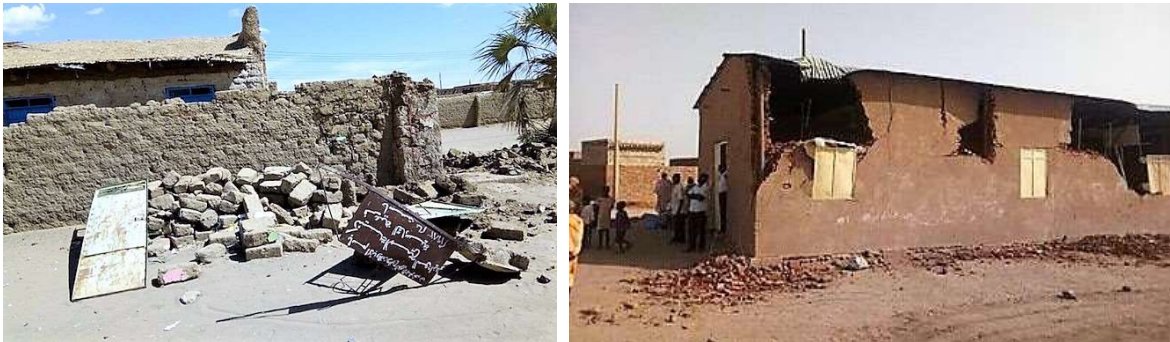
Una iglesia en Sudán, tras la demolición.

Hay una “violación sistemática” de sus derechos, dice la Iglesia de Cristo Sudanesa. El Gobierno quiere demoler una veintena de edificios y confiscar las tierras.