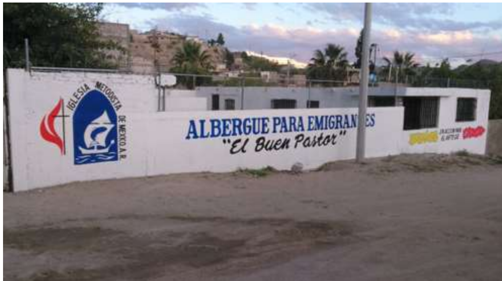
El Albergue para Migrantes en el templo El Buen Pastor

El pasado domingo 24 de Septiembre, cerca de las seis de la tarde, con una temperatura calurosa, empezaban a llegar los miembros de las congregaciones de Ciudad Juárez, que asistían a la reapertura del Albergue para Migrantes en el templo El Buen Pastor.