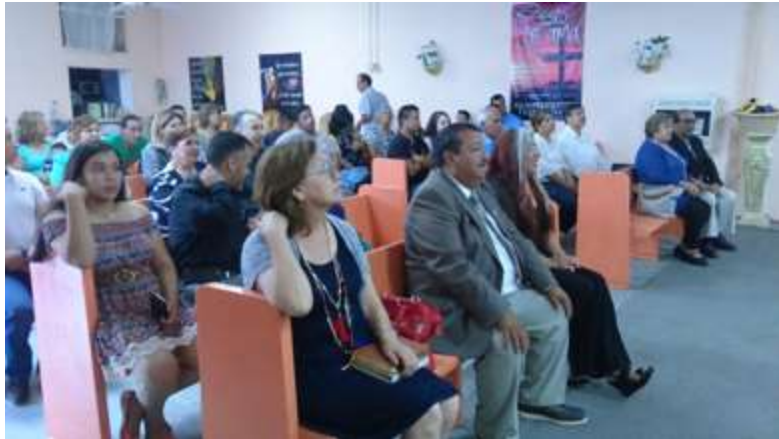
La congregación participando en el culto de reapertura del Albergue para Migrantes.

Secretaría de Gobernación, sin embargo, no pudo acompañarnos, ya que se le comisionó para organizar la ayuda para los damnificados del centro y sur del país.