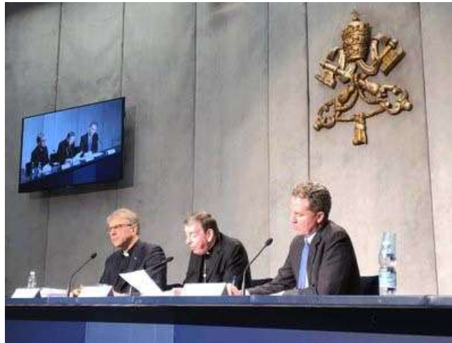
Conferencia de prensa con el Rev. Dr. Olav Fykse Tveit (izquierda) y el cardenal Koch (centro).