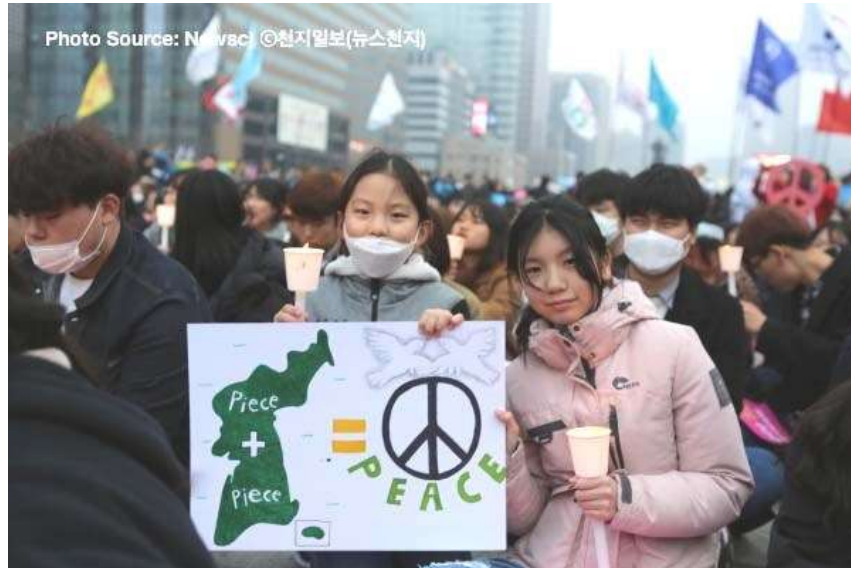
Activistas por la paz en Corea del Sur.

El Concilio Metodista Mundial celebra con entusiasmo la reciente reunión entre el presidente Moon Jae-In de Corea del Sur y Kim Jong-Un de Corea del Norte. Después de más de 70 años de separación, la histórica reunión es un bienvenido primer paso hacia la paz, la reunificación y la desnuclearización en la península de Corea.