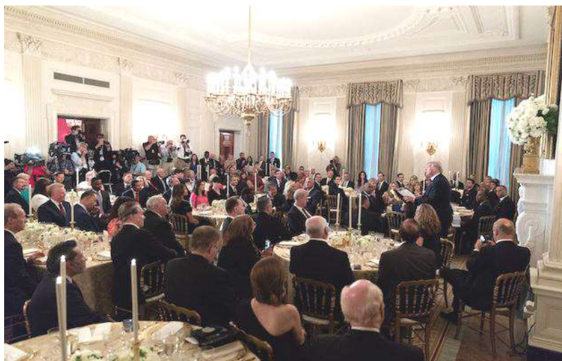
Donald Trump hablando ante los líderes evangélicos invitados a la cena de la Casa Blanca.

El presidente de Estados Unidos aseguró a sus invitados que “el apoyo que me han brindado ha sido increíble” y defendió su gestión recordándoles, entre otras cosas, el traslado de la embajada a Jerusalén.