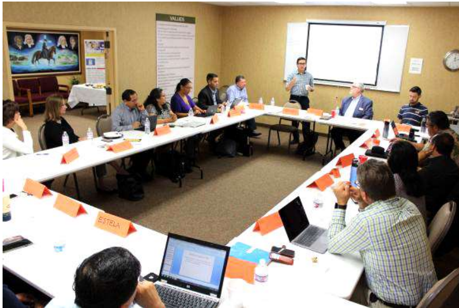
La primera reunión de esta iniciativa se celebró en Nashville el 20 de abril de 2018. Se centró en definir la visión, misión y valores que tendría este grupo estratégico.

Como parte del proceso de desarrollo, el Plan Nacional para el Ministerio Hispano-Latino (NPHLM) fue invitado a formar parte a fines de 2017.