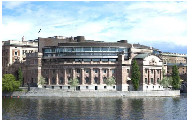
El edificio del Riksdag, el Parlamento sueco, controlado ahora por los socialdemócratas.