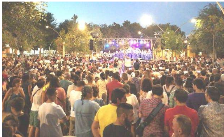
Miles de personas disfrutaron de la música del Coro Gospel Living Water.

FUENTES: Koinonía Sevilla, Protestante Digital. Sevilla, España. Septiembre 26, 2018. Este 22 de septiembre se celebró en Sevilla el ‘Día del Evangelio’, una jornada de actividades para difundir el mensaje de Jesús. Esta celebración, auspiciada por la Fraternidad de pastores y ministros de la ciudad “Koinonia”, convocó en primer lugar a cientos de personas que se unieron a la marcha por Jesús, que recorrió más de cinco kilómetros.