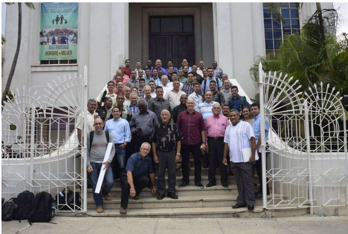
Líderes de iglesias evangélicas en Cuba.

En un tercer punto, se defienden de la etiqueta de “homofóbicos”, ya que afirman no temer, ni rechazar a las personas homosexuales. “Cumpliendo con el mandato divino, les amamos, oramos por ellos y les predicamos en Evangelio”, añaden.