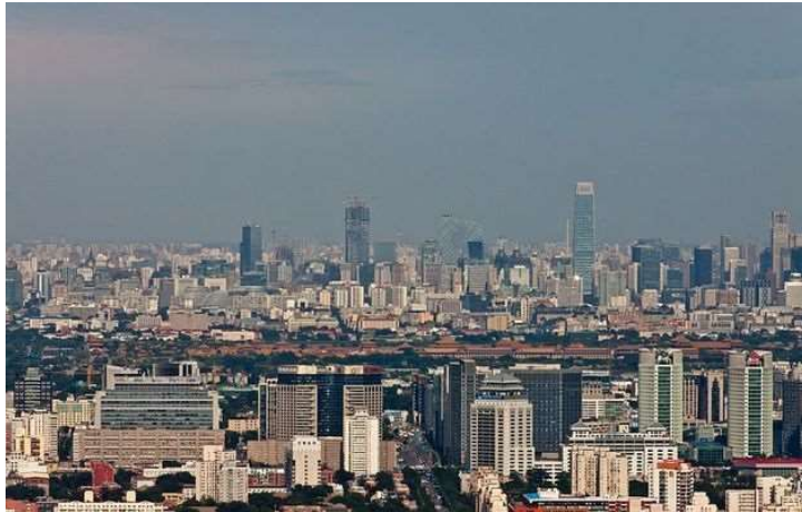
Perspectiva de Pekín.

El pastor “Ezra” explicó a la agencia de noticias AFP que los oficiales “persiguieron a todos y sellaron el lugar, incluso derribaron nuestra señalización en la pared. Todas nuestras cosas han sido confiscadas y no se nos ha permitido volver a entrar al edificio”.