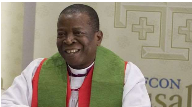
El obispo Okoh, primado de Nigeria y presidente de Gafcon.

El presidente del movimiento de carácter evangélico conservador pide plasmar un “buen desacuerdo” ante las “diferencias irreconciliables sobre la naturaleza de la Biblia y el Evangelio” en el anglicanismo mundial.