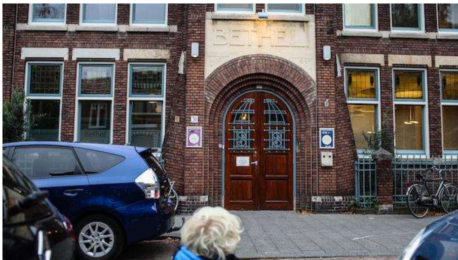
La fachada de la iglesia Bethel, en La Haya.