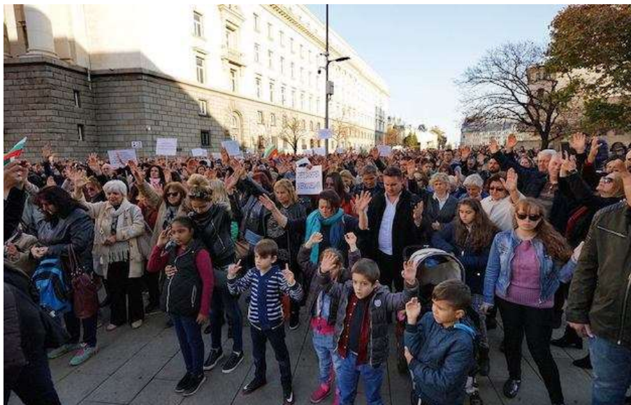
Evangélicos salieron a las calles este 11 de noviembre para manifestarse en contra de la nueva ley.

donativos, interferir con la educación teológica y establecer instrumentos de regulación estatales sobre cuestiones que tienen que ver con responsabilidades del personal religioso, el Estado búlgaro estaría asumiendo poder de forma inadecuada en la vida interna de las comunidades religiosas.