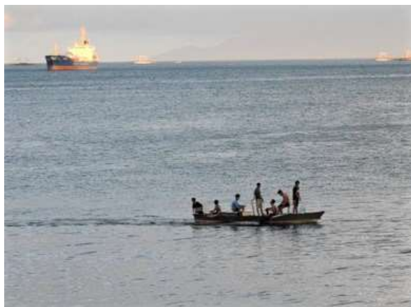
Cada día embarcaciones con cientos de migrantes de toda Indonesia llegan a la bahía de Jayapura en Papúa Occidental.