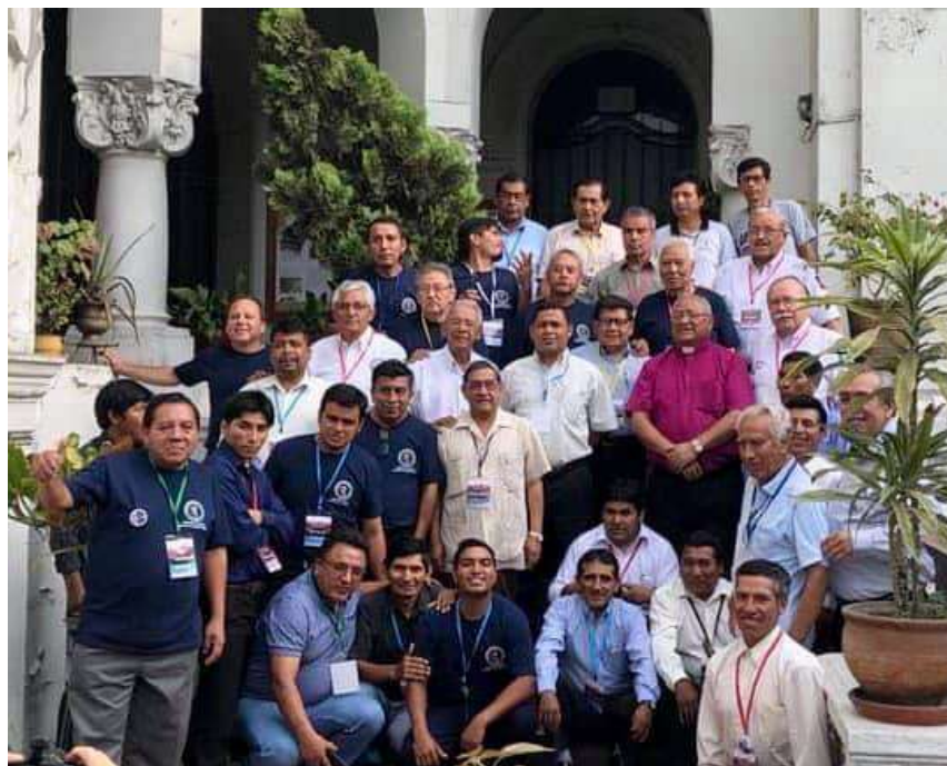
Delegados al Congreso Constituyente de la Federación de Hombres Metodistas del Perú.