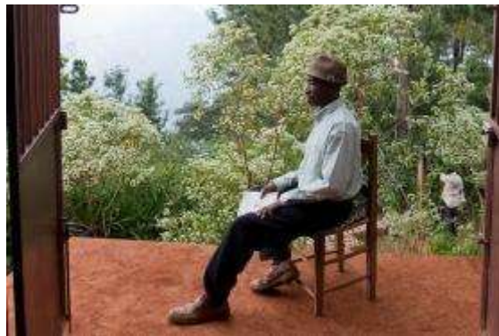
A veces Dios nos llama a hacer una pausa en el camino.

En momentos como estos, las Escrituras nos animan a hacer una pausa, escuchar y esperar activamente la guía del Espíritu. Como dice el himno, reflejando el Salmo 46:10, “Estad quieta, alma mía: vuestro Dios se comprometerá a guiar el futuro, como en los tiempos pasados” (“Estad quieta, alma mía” verso 2, Himnario Metodista Unido 534 en inglés, http://www.umc.org/what-we-believe/glossary-hymnal-the-united-methodist ).