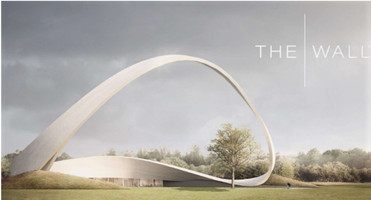
Vista virtual del proyecto del muro. / The Wall “El muro de las oraciones respondidas” podría ser una realidad en 2022.

Las afueras de Birmingham, en el Reino Unido, es el lugar en el que se construirá la escultura, que contará con un millón de ladrillos y se espera inaugurar en 2022.