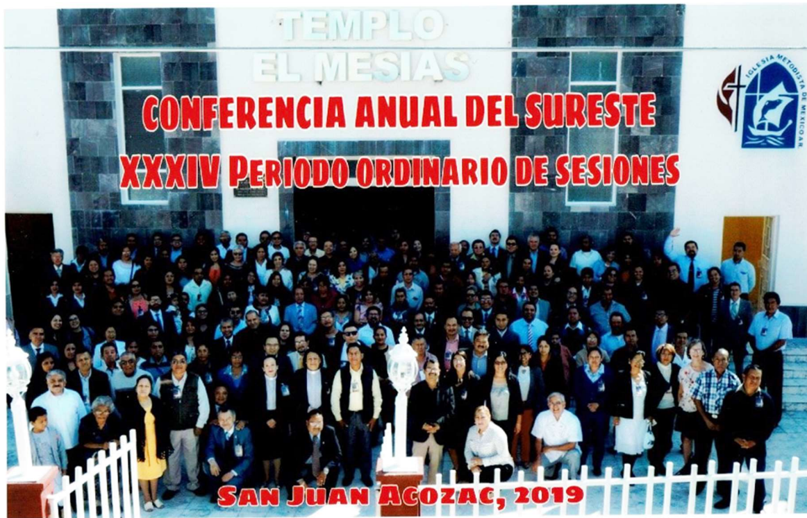
Fotografía oficial del XXXIV periodo de sesiones de la CASE.

de la Iglesia “Éfeso” de Oaxaca capital por su labor de composición musical con enfoque doctrinal y bíblico.