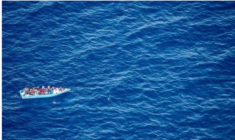
La barca en peligro que fue ignorada durante 14 horas por Libia, Italia y barcos mercantes a pesar de estar localizada. Sea-Watch.

presidente del Consejo, Heinrich Bedford-Strohm, ha anunciado este miércoles en Berlín la creación de una asociación que comprará su propia embarcación.