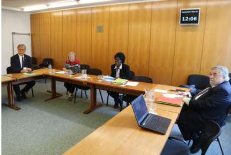
Equipo directivo del Comité Central del Consejo Mundial de Iglesias. Fotografía: Ivars Kupcis/CMI.

FUENTE: CMI. Ginebra, Suiza. Septiembre 12, 2019. Los dirigentes del Comité Central del Consejo Mundial de Iglesias (CMI) se reunieron en Ginebra los días 10 y 11 de septiembre para preparar la reunión del Comité Ejecutivo, la reunión del Comité Central y la 11ª Asamblea del CMI, que tendrá lugar en 2021.