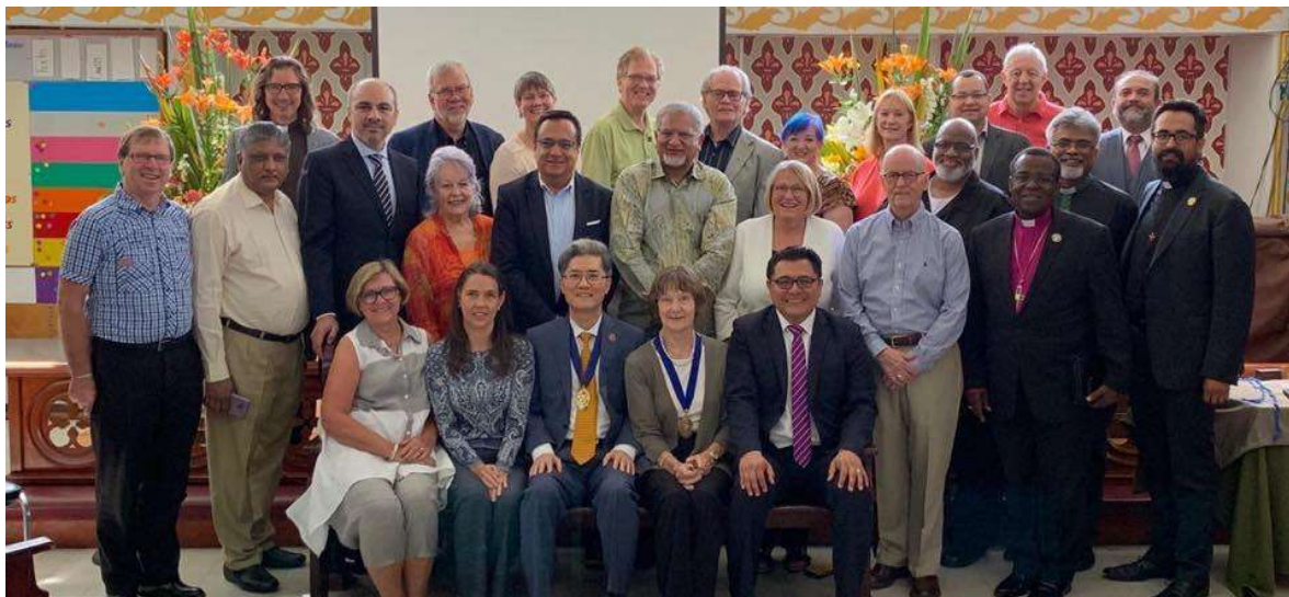
Comité Directivo del Consejo Metodista Mundial Ciudad de México, 28 al 30 de agosto de 2019.

La Oficina Ecuménica Metodista en Roma (MEOR) está actualmente ocupada por una persona nombrada provisional. La descripción del trabajo se ha revisado y el puesto se anunciará con una fecha de inicio para el nuevo designado de septiembre de 2020.