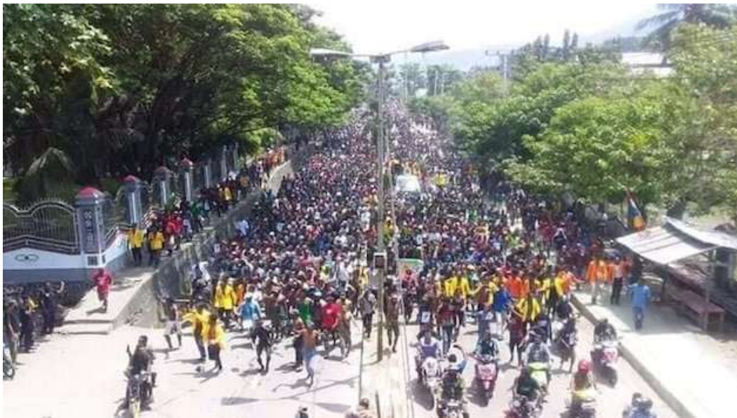
Una manifestación este agosto en Jayapura.

Las protestas por la independencia se han reavivado en esta parte del archipiélago indonesio. Los cristianos autóctonos, dice un antiguo misionero alemán en el territorio, “están erróneamente más centrados en las cuestiones internas”.