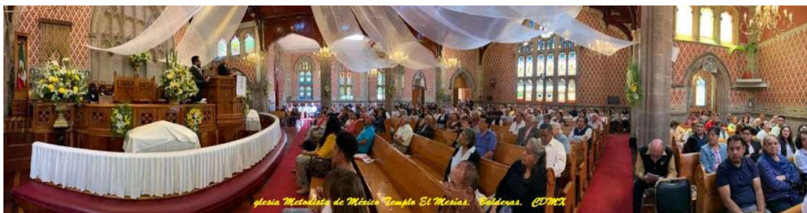
Sede Templo El Mesías, Balderas 47, CDMX.