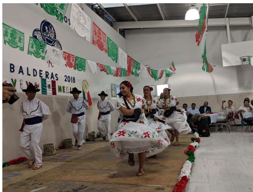
Bailes folclóricos presentados durante la reunión del Comité Directivo del CMM.