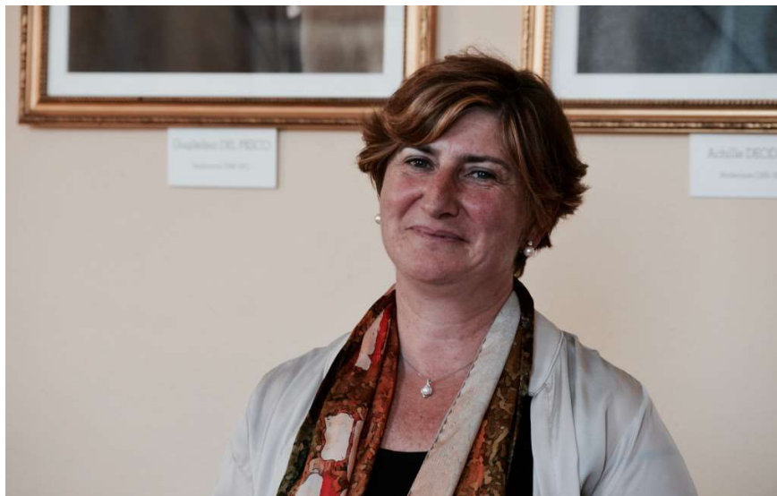
Alessandra Trotta, nueva Moderadora de la Iglesia Valdense de Italia.

FUENTE: Iglesia Protestante Unida de Francia. Torre Pelice, Italia. Septiembre 3, 2019. El Sínodo de la Iglesia Valdense cerró en esta localidad de Italia el 31 de agosto con el anuncio del nombramiento de su nueva moderadora [Presidente: N. de la R.], Alessandra Trotta, a la cabeza de la Iglesia Valdense.