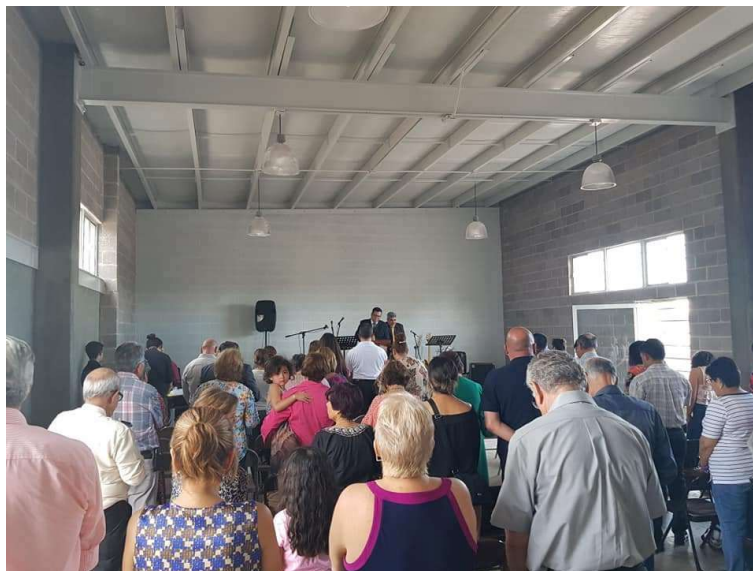
Templo metodista Rey de Reyes en Riberas del Sacramento, Chih. dedicado el pasado 8 de septiembre, con la presencia del obispos Rodolfo Rivera (CANCEN).

Que sea un lugar de adoración al Señor, de ministerios de amor y servicio al prójimo.