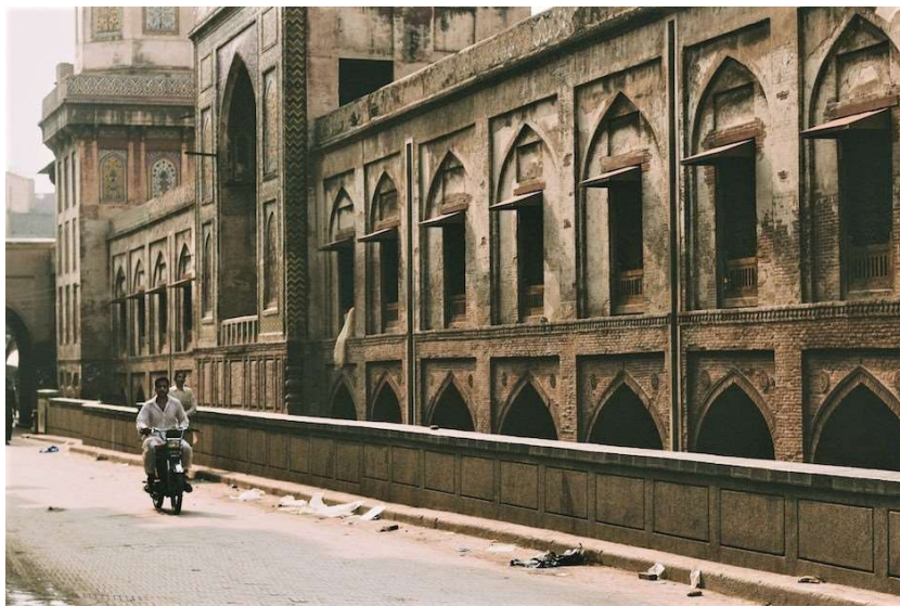
Un motorista en Lahore. Pakistán es el país en el que se han registrado más incidentes en cuanto a la ley de blasfemia.

reportados en 41 países. Hasta 674 fueron casos de aplicación de la ley de blasfemia criminal por parte del Estado.