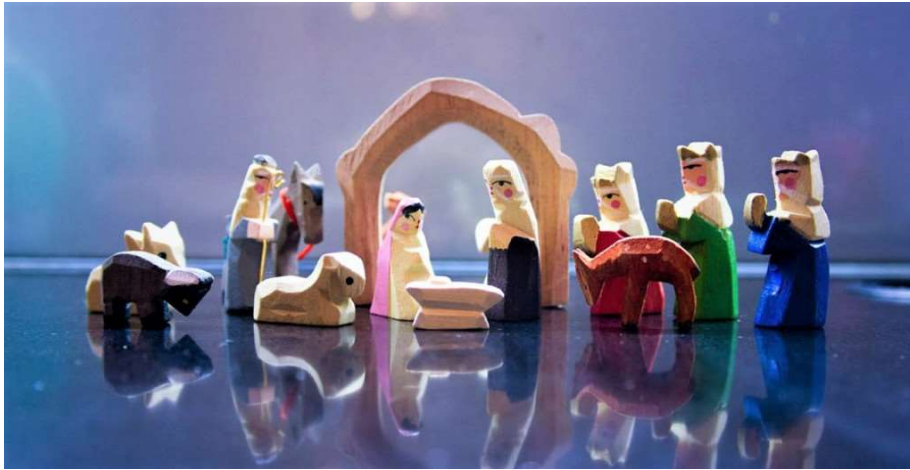
Los adornos navideños, como este sencillo belén, nos ayudan a celebrar la temporada.

continuamos celebrando el nacimiento de Jesús, la Palabra de Dios hecha carne. quien hizo su hogar entre nosotros (Juan 1:14 CEB).