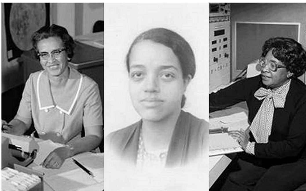
Katherine Johnson, Dorothy Vaughan, Mary Jackson Katherine Johnson, Dorothy Vaughan y Mary Jackson: figuras ocultas de la NASA