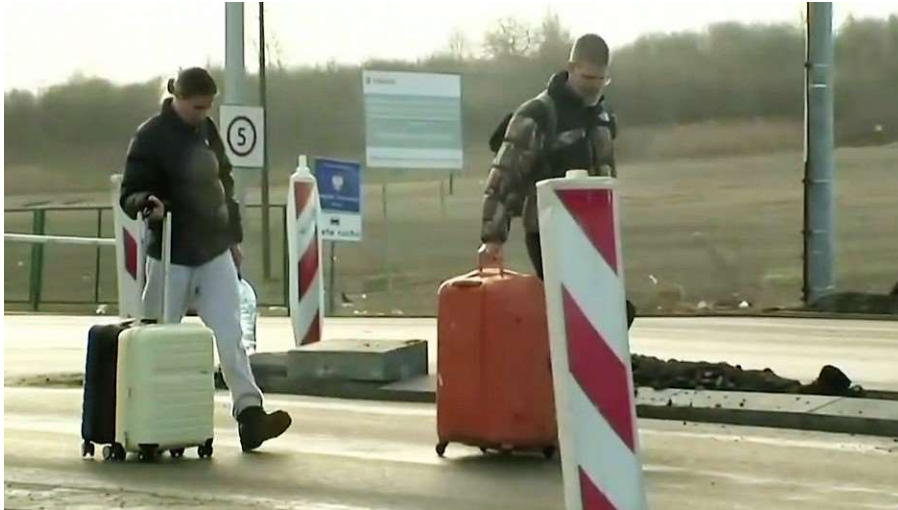
Dos jóvenes ucranianos arrastrando su equipaje por una carretera.

Mientras el ejército ruso alcanza la capital del país, Kiev, unos 100.000 ucranianos han huido de sus casas, según las primeras estimaciones de ACNUR. De ellos, miles han cruzado la frontera nacional.