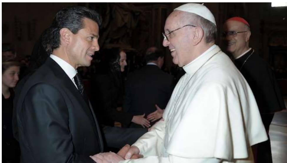
Bergoglio saludando al expresidente mexicano Peña Nieto.

Sin lugar a dudas, el mapa religioso de México ha venido cambiando. En especial en estos últimos treinta años. En 1990, el censo de población reportaba que 89.7% de la población se decía católica. El Censo de 2020 indica que los católicos han descendido a 77.7%, es decir, hay un descenso de 12 puntos porcentuales. La caída ha sido “suave” comparada con diversos países en América Latina. Por su parte, los evangélicos siguen creciendo de manera sostenida: las personas que declararon pertenecer a iglesias protestantes y evangélicas pasaron de 3.2% en 1980, a 7.3 en 2000, y a 11.2 en 2020. Aunque algunos líderes pentecostales quisieran cifras más altas para su lucro político, como el pastor Arturo Farela, de Confraternice, quien vaticinaba que en México había 35 millones de evangélicos. [...]