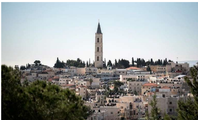
Iglesia de la Ascensión, vista desde el Monte de los Olivos, en Jerusalén.

Se acerca la Semana Mundial por la Paz en Palestina e Israel 2022, que tendrá lugar en septiembre, por lo que el Consejo Mundial de Iglesias invita a las personas e iglesias de todo el mundo a unirse para orar, mostrar solidaridad con la población de la Tierra Santa y sensibilizar sobre los problemas que afronta.