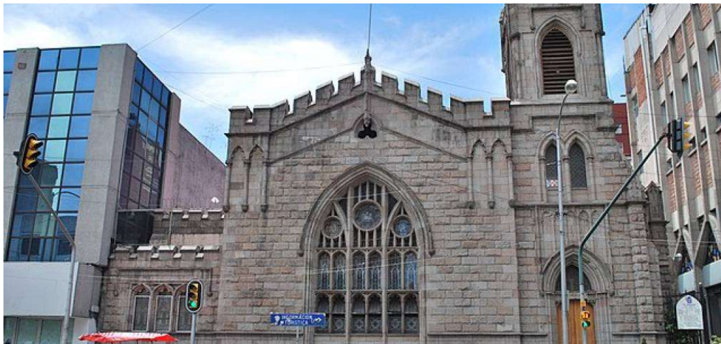
Fachada del templo metodista El Mesías, en la calle de Balderas, en la Ciudad de México.

El pronunciamiento de quienes se oponen a esta visión tan restrictiva afirma que: “La declaración adoptada es reduccionista y denota un desconocimiento científico, ético y jurídico de la cuestión, y está muy lejos de contemplar las diversas situaciones de violencia que vivimos las mujeres. este pueblo. ¿Cómo vamos a alzar la voz por los sin voz? Crearemos albergues para niñas y niños como en los inicios del metodismo, o para mujeres que sobrevivieron a la violencia, brindaremos educación sexual clara y no estigmatizada para prevenir la violencia, haremos público el registro de agresores dentro de la iglesia, ¿Acompañará a las mujeres que han tenido que hacer frente a esta complicada situación?