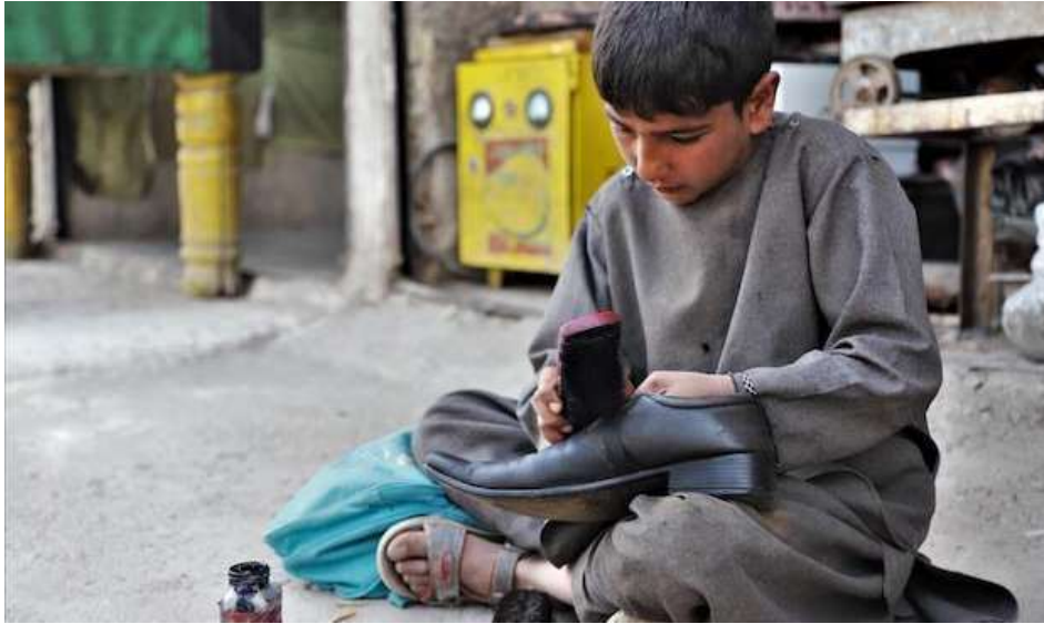
Con la pandemia, en Afganistán la mitad de familias ha enviado sus hijos a trabajar.