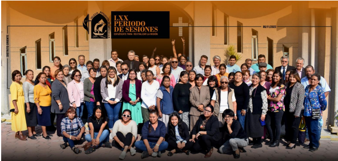
FOTOGRAFÍA OFICIAL DE LA XXX PERIODO DE SESIONES DEL DISTRITO ORIENTE, 5 NOV. 2022

Para finalizar se eleva la oración de clausura para honra y gloria de nuestro único Dios Trino. Amén.