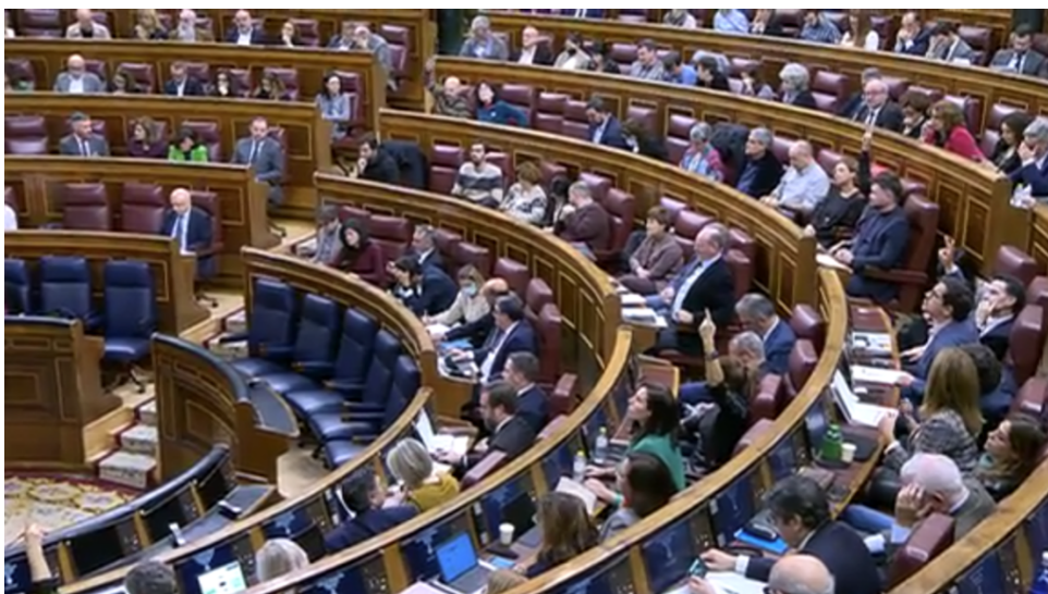
Votación en el Congreso de los Diputados este jueves 22 de diciembre.

la oposición de profesionales, expertos, así como distintos grupos y movimientos sociales que avisan de consecuencias negativas en la sociedad derivadas de la ejecución de la ley.