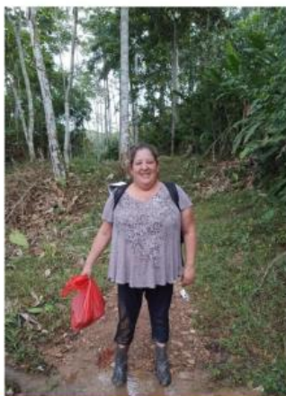
Caminando en la selva para entregar los paquetes