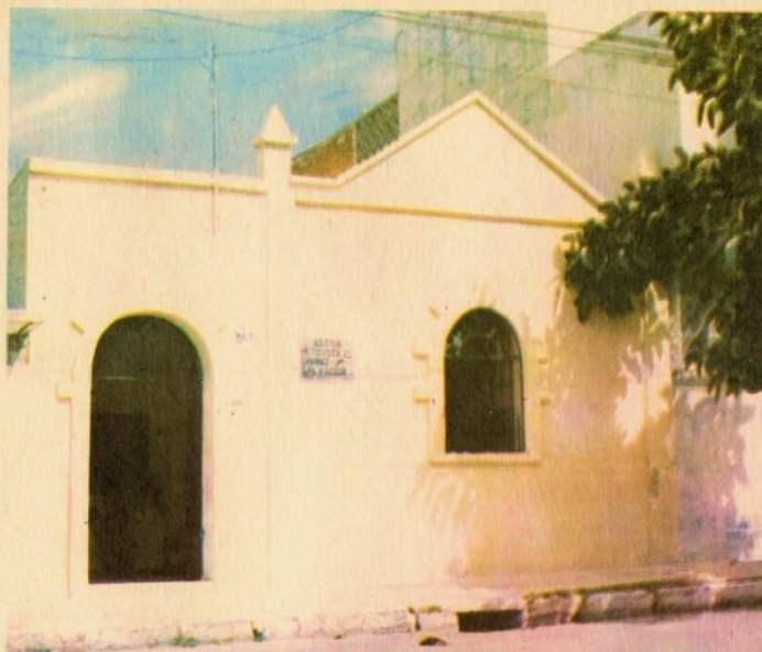
Templo "El Divino Salvador"

cumplió 50 años, y ahora yo dedico la presente recopilación a la conmemoración del quincuagésimo aniversario de la iglesia en que me congreco.