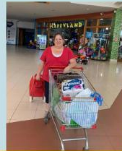
Haciendo compras para la capacitación