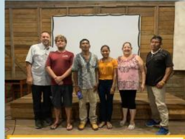
Alumnos y el Director de CAMIT

Como les mencione arriba muchas cosas pasaban al mismo tiempo, ya que en enero también tuve una semana de traducción para avanzar, pues en el mes de febrero por primera vez estaría visitándonos nuestro consultor, que es la persona encargada de que la traducción se realice correctamente.