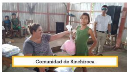
Comunidad de Sinchiroca

En medio de todas estas cosas, también tuve la gran bendición de poder llevarle a los niños de nuestras iglesias kakataibas, paquetes de útiles escolares, gracias a tres hermosas iglesias de Maryville, Tennessee, las hermanas de la femenil Dórcas de La Trinidad en Monterrey y al esfuerzo de la iglesias ICP, de Pucallpa que ayudaron en la preparación de los paquetes, pudimos multiplicar las finanzas para así poder bendecir a 315 estudiantes, de 4 comunidades diferentes. Sin duda alguna esto fue un gran trabajo en equipo.