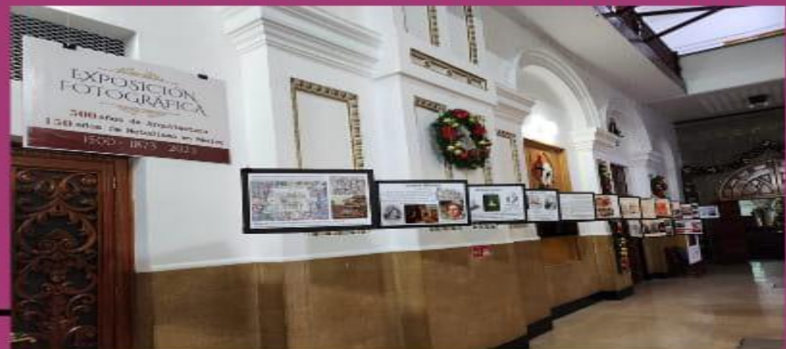
• (2023). Exposición Fotográfica. Keyla V. Tavera Flores

Iglesia Metodista "La Santísima Trinidad", Gante