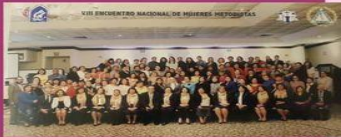
VIII Encuentro. Monterrey, N. L. del 18 al 20 de noviembre 2016