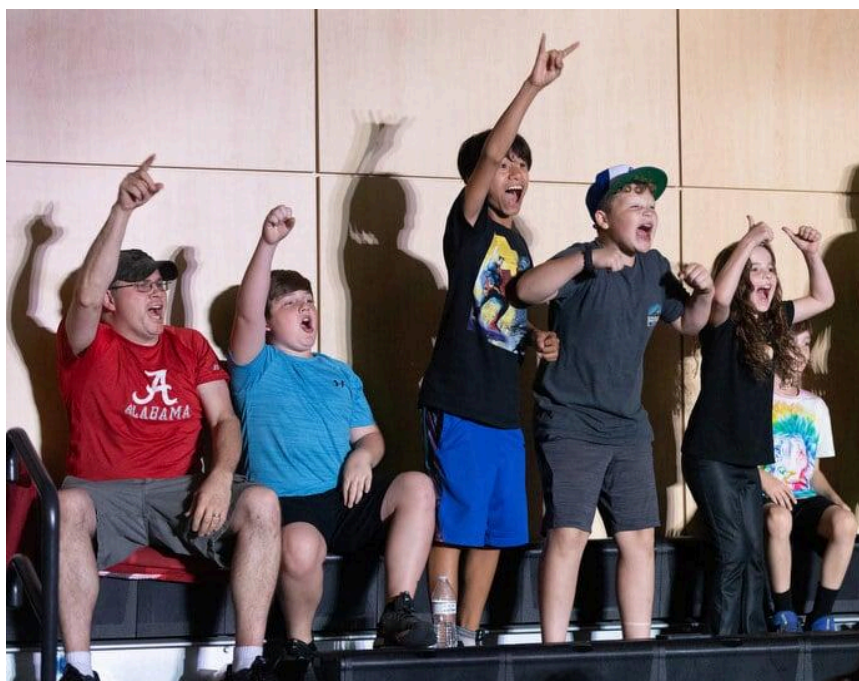
Jóvenes fanáticos/as aplauden durante un evento de New South Pro Wrestling celebrado el 2 de noviembre en el Centro de Eventos de Priceville, Alabama.