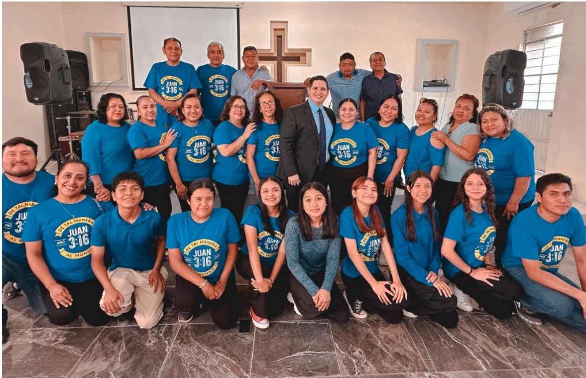
Equipo de Trabajo De la Iglesia Eben Ezer. Reconociendo también a los hermanos que trabajaron arduamente tras bambalinas que no aparecieron en esta fotografía.