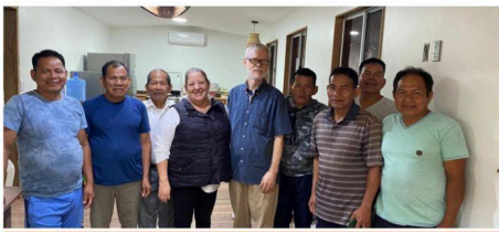
Asisten Equipo de traductores y Lingüistas

Fue muy gratificante ver durante la campaña como los traductores, estaban compartiendo el evangelio con las personas que esperaban atención, primero les leían alguna parte de los primeros capítulos de Lucas y después les hablaban de Jesús y les invitaban a la iglesia. También tuvimos la oportunidad de regalarles a las personas interesadas un ejemplar del libro de Mateo.