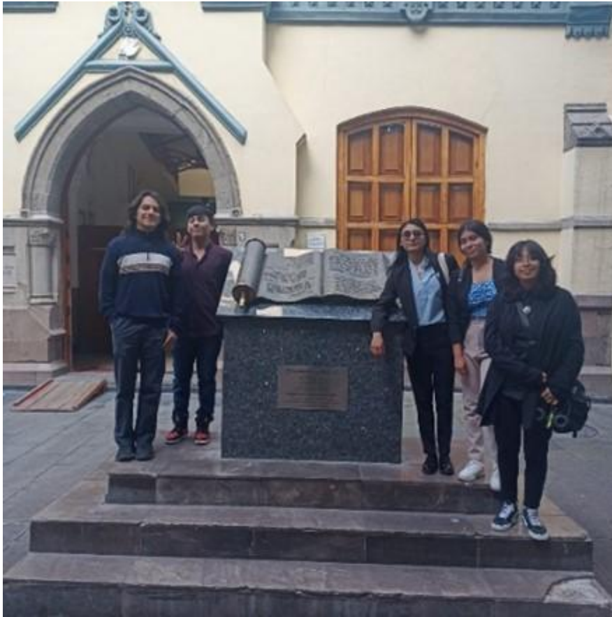
Monumento a la Biblia (SBM)