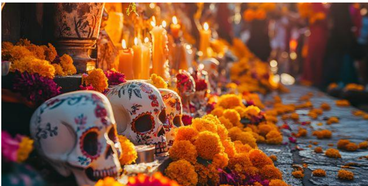
Decoración para el Día de Muertos.

El año pasado, las autoridades educativas también comunicaron que la participación en estas actividades no era obligatoria.