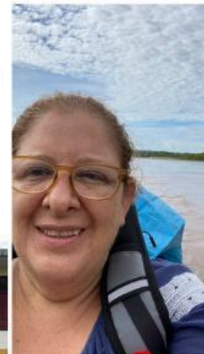
Regresando a Pucallpa