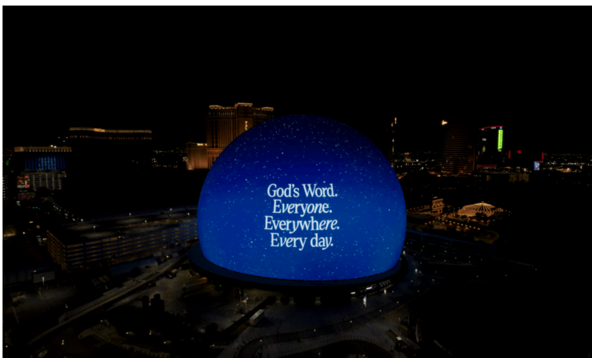
Anuncio de la campaña el Mes Global de la Biblia en Las Vegas.

Varios influencers han estado animando a sus seguidores a leer la Biblia cada día en redes sociales.