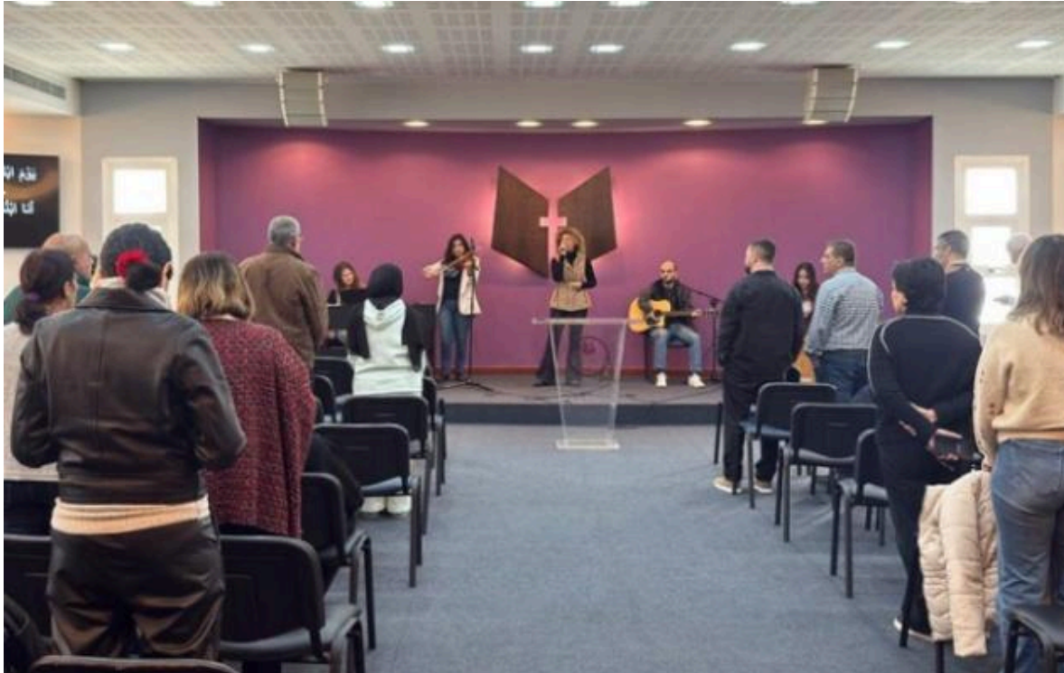
Una reunión de oración y alabanza en el seminario, en marzo de 2026.

También se percibe un sentir de unidad entre los cristianos en el Medio Oriente, más allá de las fronteras nacionales. “Nuestros hermanos y hermanas en todo el Medio Oriente también han sufrido más que suficiente conflictos y sufrimiento. Sin embargo, recibimos con frecuencia mensajes cálidos y alentadores de nuestros estudiantes y de sus iglesias en toda la región, compartiendo que están orando por nosotros en este tiempo tan difícil”.