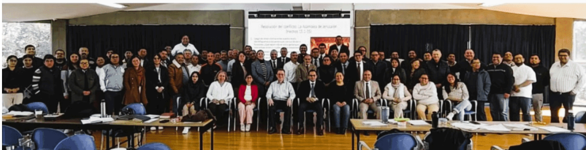
Talleres de enero 2026, Seminario, UMAD.

Que el Señor continúe bendiciendo el esfuerzo de nuestras Iglesias, Distritos y Conferencias Anuales, que con visión y esperanza sostienen este ministerio formativo. En la conexionalidad entre las distintas partes de la Iglesia radica nuestra fuerza, y en la misión compartida, se encuentra nuestro propósito común.