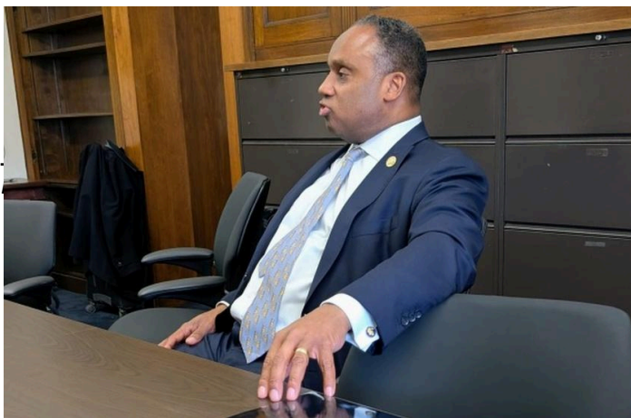
El congresista Jonathan L. Jackson, en una reunión con parlamentarios europeos tras el Desayuno Nacional