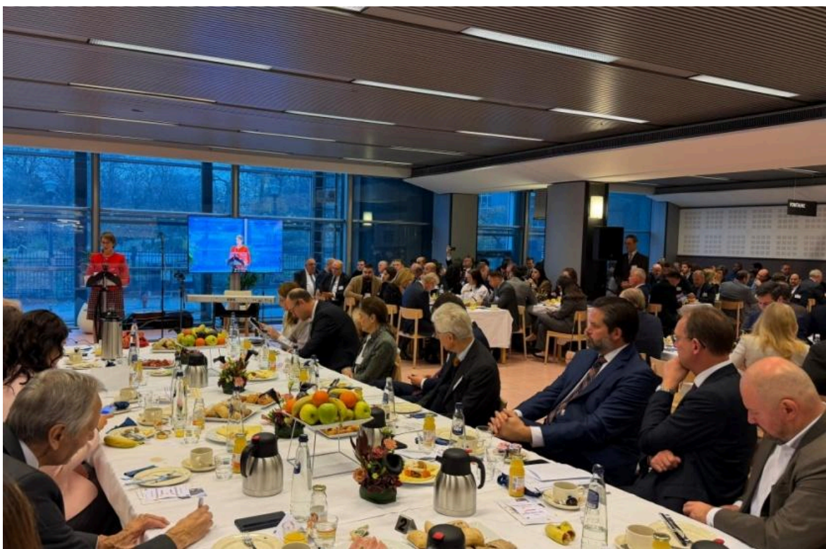
Invitados al Desayuno Europeo de Oración 2025 en el Parlamento Europeo, en Bruselas, Bélgica.

El Desayuno de Oración ya tiene una larga historia en Europa. Se celebra anualmente en el Parlamento de la Unión Europea en Bruselas, pero también en países como Ucrania, España, Rumanía, y otros.